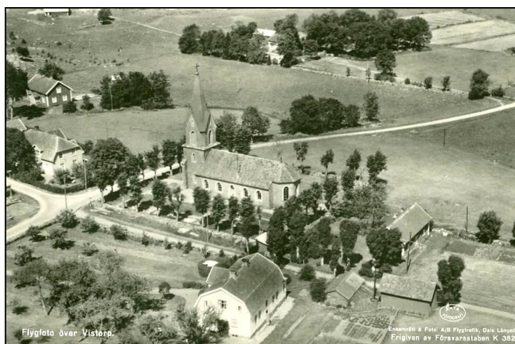
Flygfoto från tidigt 1960-tal. Bossgården t.h. "bakom" kyrkan. Bossgården revs under 1960-talet.