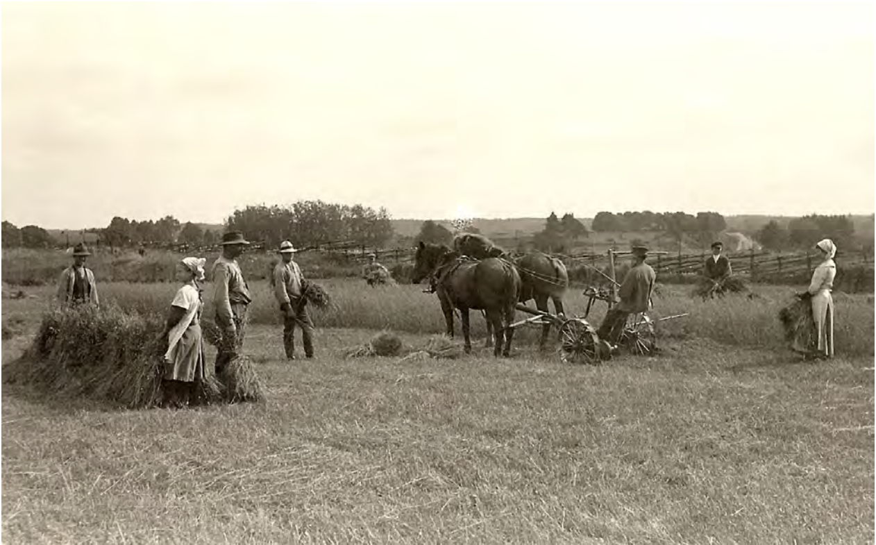
Skördetid på Trädets Gård 1912

kaffe. När arbetslaget var ute på fälten serverades alltid eftermiddagskaffet där arbetet pågick. Då kom Mor eller någon av småtöserna med kaffekorgen och den stora kopparkaffekokaren full med härligt bönkaffe – kokt. ”Vid dikesrenen vi satt och från den kom glada skratt.” Den minnesbilden är ljus och fin. Men ack vad tiden gick fort, och än var jobbet för dagen inte slut. Klockan sju och trettio på sommaren var arbetsdagen slut, klockan sex under vinterhalvåret.