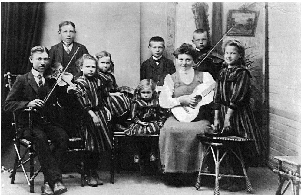
Den musikaliska barnskaran