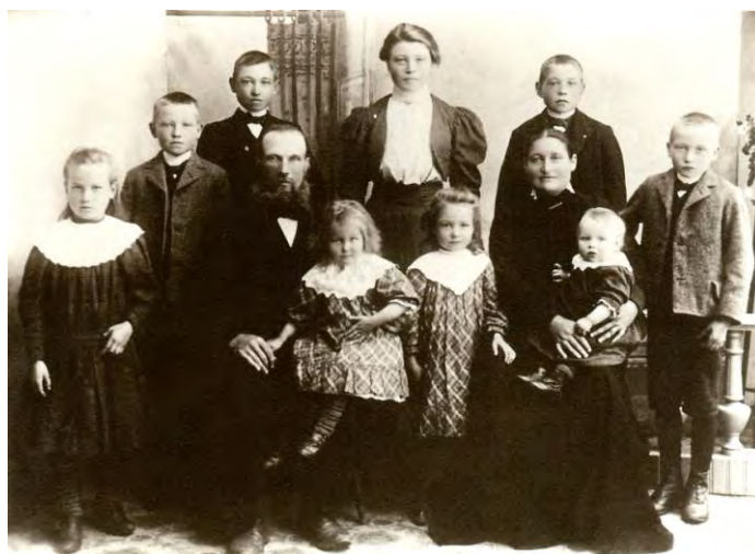
Familjen Sandström omkring 1908.

Tack o Gud för vad som varit Tack för allt vad du beskär Tack för tiderna som farit Tack för stunden som nu är Tack för ljusa varma vårar Tack för mörk och kulen höst Tack för redan glömda tårar Tack för friden i mitt bröst.